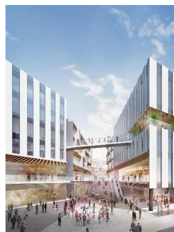
交通広場より (イメージ)