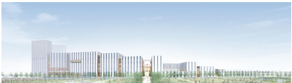
多摩川方面より (イメージ)