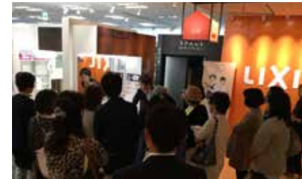
前回のイベント(ショールーム見学ツアー)の様子

千葉 7/1 (日) 船橋会場 | 東京・神奈川 7/7 (土) 新宿・相模原会場 | 東京 7/8 (日) 立川会場 埼玉 7/14 (土) さいたま会場 | 神奈川・千葉 7/21 (土) 横浜・千葉会場