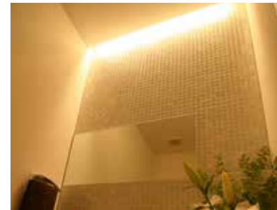
ミラー部分に間接照明をつけ、心安らぐ空間に。