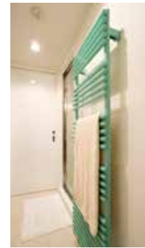
ヒートウォーマーを取り付けて、冬はバスタオル掛け、梅雨～夏は雨天時の洗濯物干しとして。