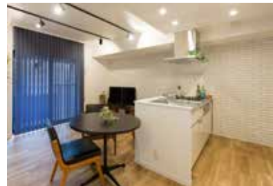
ダイニングとつながるオープンキッチンに、タイル貼りでアクセントを。