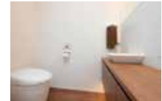
脱臭・調湿効果があるエコカラットを貼り、ニオイの原因物質や湿気をキャッチ。