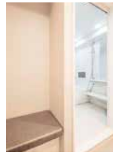
お風呂あがりに一息ついて寛げる腰掛を設置。