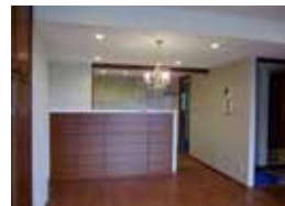
キッチンの背面にカップボードを設置し、リビング側から見えないように壁を造作。